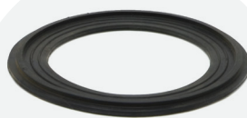
Goma para brida 63mm a 200mm