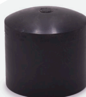
Tapa *BF 63mm a 160mm