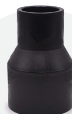
Reducción *BF 63mm a 200mm