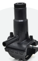
Toma en carga *EF 63mm a 160mm