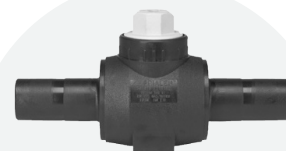
Llave de paso *BF 63mm a 110mm