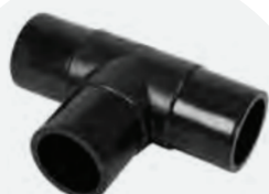
Te *BF 75mm a 200mm