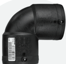
Codo 90° *EF 20mm a 160mm