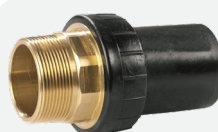
Transición Rosca Macho *BF/RM 63mm a 110mm