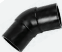
Codo 45° *BF 90mm