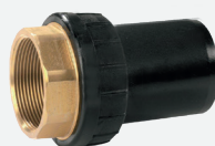
Transición Rosca Hembra *BF/RH 63mm a 110mm