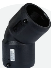
Codo 45° *EF 25mm a 160mm