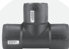
Te *EF/BF 32mm a 160mm