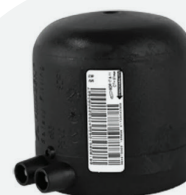
Tapa *EF 63mm a 160mm