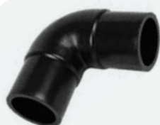
Codo 90° *BF 90mm a 160mm