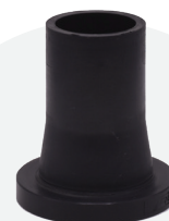
Adaptador a brida espiga *BF 63mm a 200mm