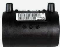
Cupla *EF 20mm a 200mm