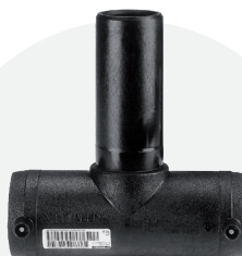
Te *EF 75mm a 160mm